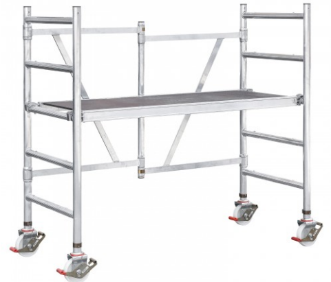
▲ Abbildung: Grundeinheit OHNE Durchstieg (Art.-Nr. 50625)