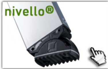
nivello® - Leiterschuhe 4-fach größere Auflagefläche