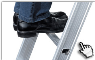
32mm tiefe, gewinkelte Trapezsprossen