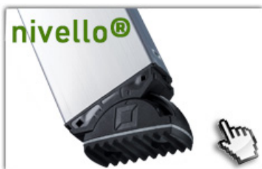
nivello® - Leiterschuh 4-fach größere Auflagefläche

GS-geprüft, entsprechend europäischer Norm DIN EN 131, Betriebsicherheitsverordnung (BetrSichV), TRBS 2121, Handlungsanleitung BGI 694 und geltenden Unfallverhütungsvorschriften