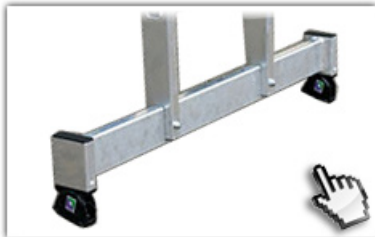
nivello® - Traverse extra hohe Standsicherheit

GS-geprüft, entsprechend europäischer Norm DIN EN 131, Betriebssicherheitsverordnung (BetrSichV), TRBS 2121, Handlungsanleitung BGI 694 und geltenden Unfallverhütungsvorschriften.