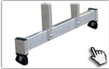
nivello® - Traverse extra hohe Standsicherheit

GS-geprüft, entsprechend europäischer Norm DIN EN 131, Betriebssicherheitsverordnung (BetrSichV), TRBS 2121, Handlungsanleitung BGI 694 und geltenden Unfallverhütungsvorschriften.